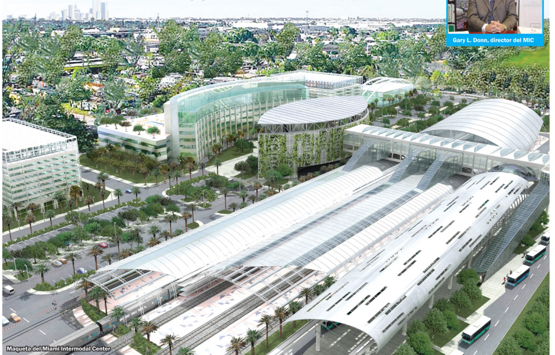
Maqueta del Miami Intermodal Center