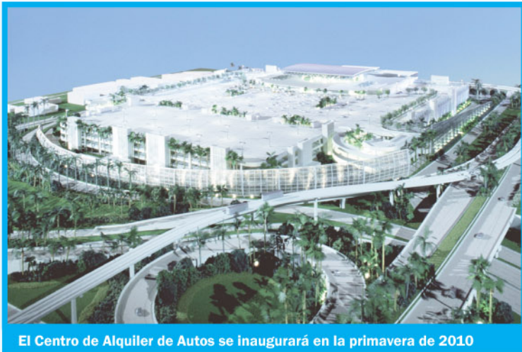
El Centro de Alquiler de Autos se inaugurará en la primavera de 2010

Para esta fecha el próximo año, el sofisticado Centro de Alquiler de Autos del Centro Intermodal de Miami (MIC, por sus siglas en inglés), abrirá sus puertas. Es el primer paso a otra era de transporte del condado.